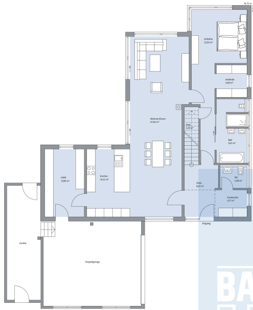
Haus Achenbach Grundriss