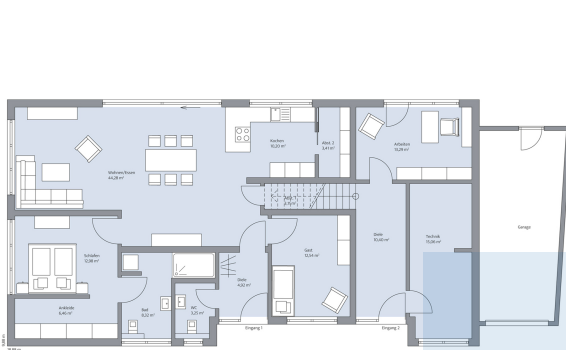
Haus Ising Grundriss EG