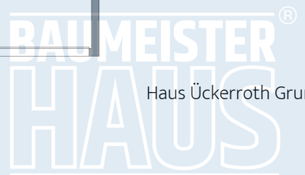
Haus Ückerroth Grundriss