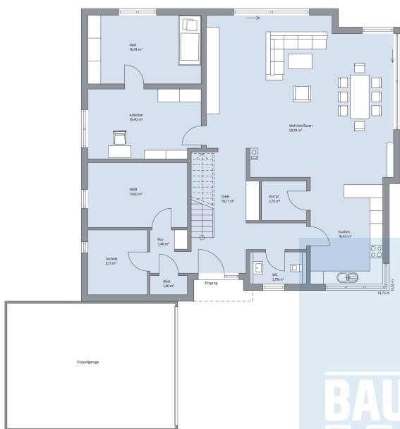
Haus Abendroth Grundriss