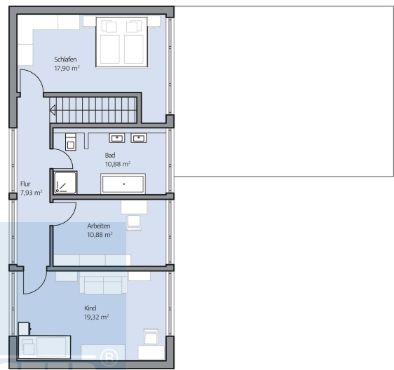
Haus Augstein Grundriss