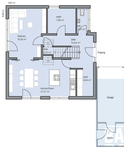
Haus Daniel Grundriss