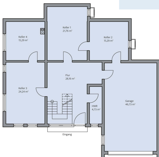
Haus Schönherr Grundriss